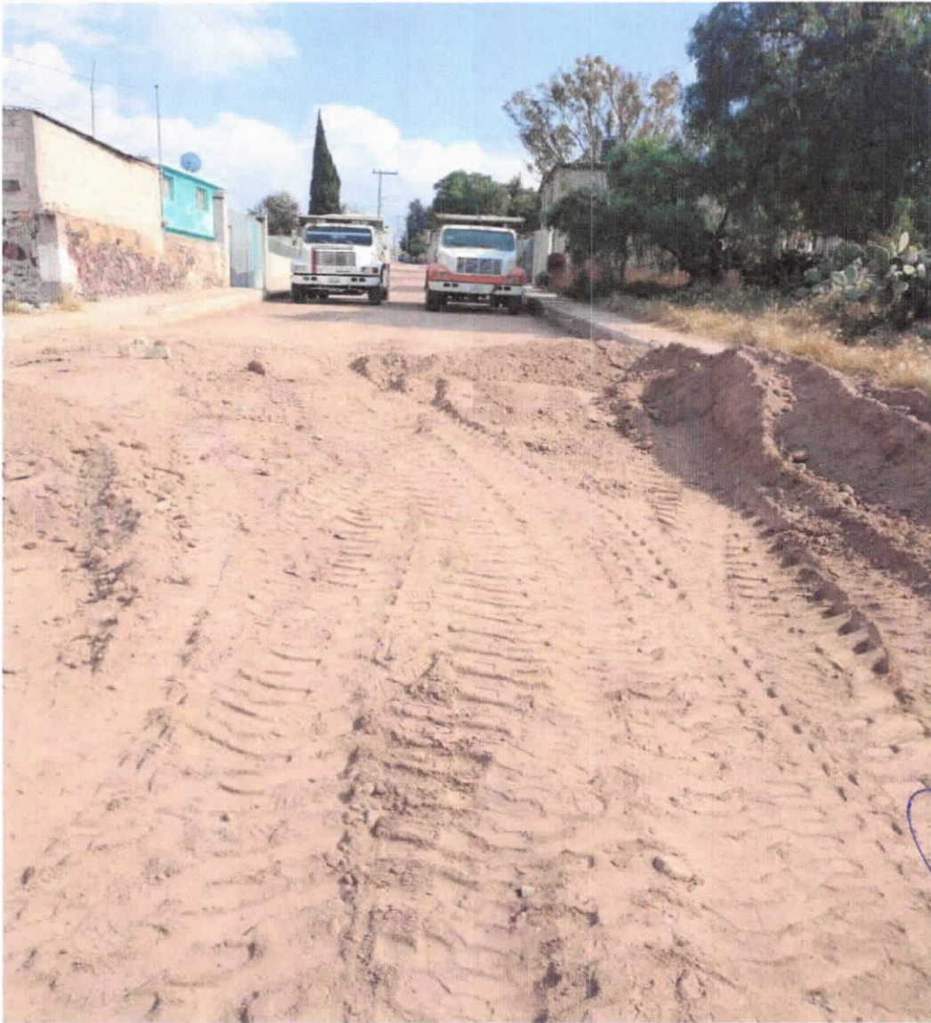
Empedrado calle niño perdido barrio el cerrito